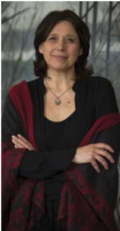
Maja Vodanovic Mairesse d'arrondissement Borough Mayor